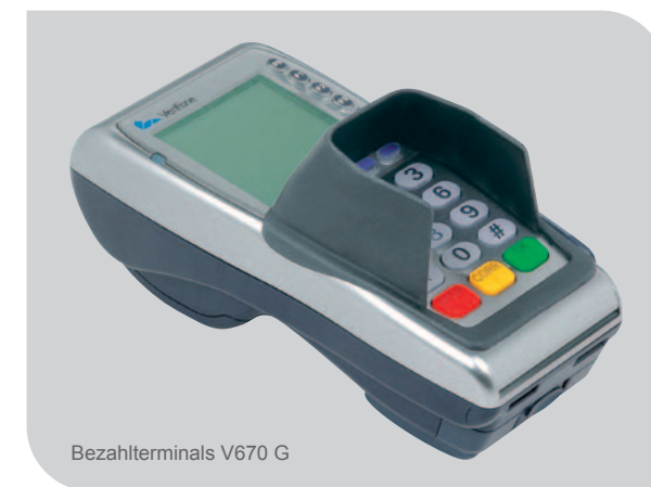
Bezahlterminals V670 G

Technischen Schnickschnack brauchen Sie nicht, solide Bezahlterminals schon – wie das mobile V670 G. Das kompakte, leicht zu bedienende Gerät ist besonders stabil und damit perfekt geeignet für den Arbeitsalltag im Handwerk. Und dank GPRS-Karte und leistungsfähigem Akku können Sie an fast jedem Ort bargeldlos kassieren.