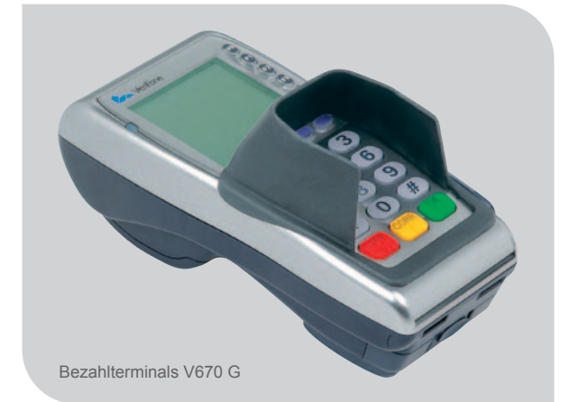
Bezahlterminals V670 G

Technischen Schnickschnack brauchen Sie nicht, solide Bezahlterminals schon – wie das mobile V670 G. Das kompakte, leicht zu bedienende Gerät ist besonders stabil und damit perfekt geeignet für den Arbeitsalltag im Handwerk. Und dank GPRS-Karte und leistungsfähigem Akku können Sie an fast jedem Ort bargeldlos kassieren.